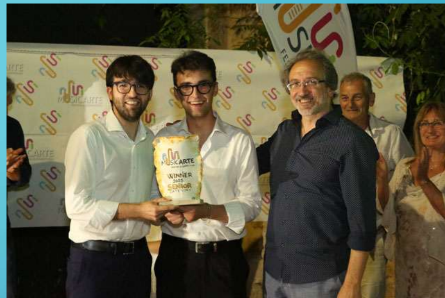
DUO SUMMA/CALIANNO – ITALIA - SENIOR